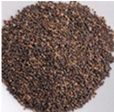
太田油脂提供画像